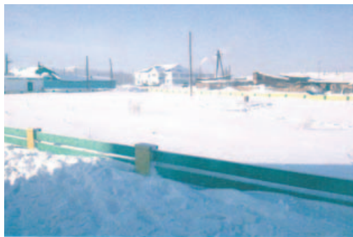
Вид территории до реализации проекта